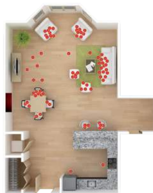
HERO registrerer hvor i rummet du befinder dig

Der er indbygget en scanner i HERO's inddel. Den såkaldte I-see sensor. Den registrerer, hvor i rummet du befinder dig, og retter luftstrømmen til, så du får den optimale varme - eller køling - præcis der, hvor du er. Flytter du dig fra sofaen til spisebordet, flytter luftstrømmen med. Og hvis du forlader rummet, og glemmer at slukke for HERO, slukker den automatisk, når den scanner, at du ikke er der længere. Smart ik'?