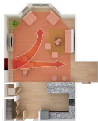
- og tilpasser styrke og retning på luftstrømmen herefter